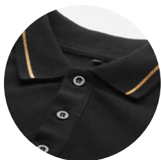
Rayas opcionales en el cuello