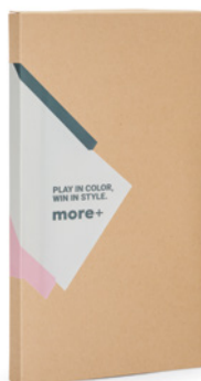
100 Caja kraft con adhesivo MOQ