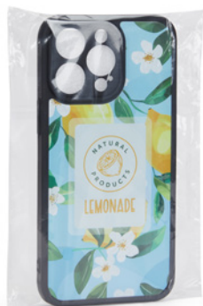
100 A granel MOQ

Elige el embalaje a granel o en caja de regalo individual personalizada.