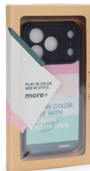
100 Caja con ventana de kraft con adhesivo MOQ