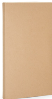
100 Caja kraft MOQ