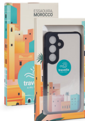
500 Caja con ventana a todo color MOQ